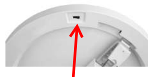
Volba teploty chromatičnosti